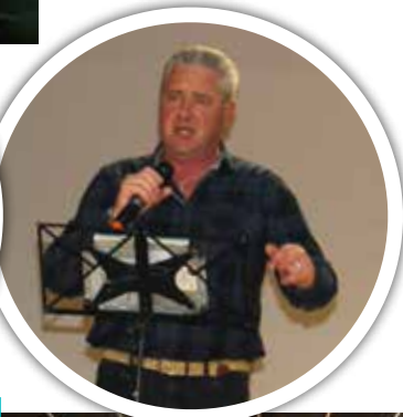
Animation, ils ont poussé la chansonnette