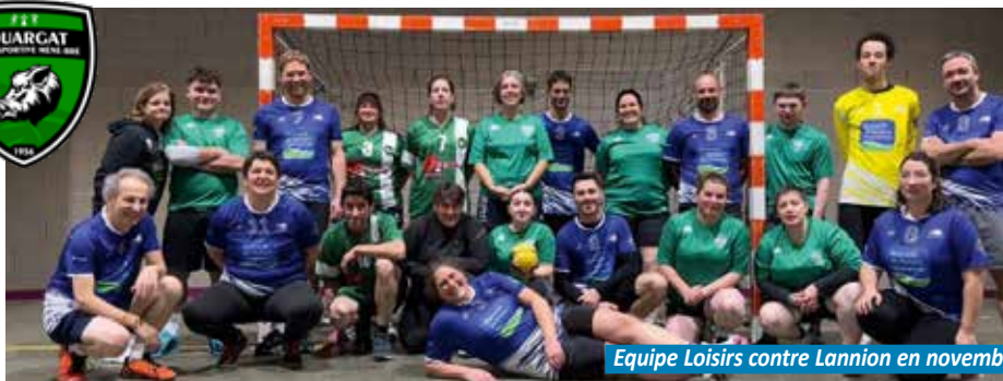
Equipe Loisirs contre Lannion en novembre