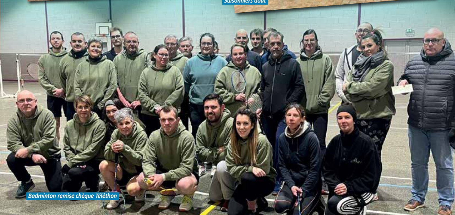
Badminton remise chèque Téléthon