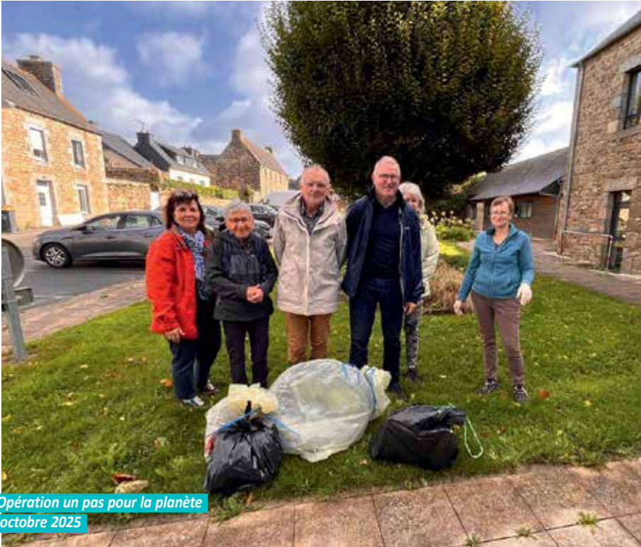
Opération un pas pour la planète octobre 2025

Dans le cadre d'un pas pour ma planète, une nouvelle opération de ramassage des déchets a été organisée par la municipalité le 4 octobre 2025. Seulement 6 personnes ont bravé la météo qui s'est finalement avérée clémente lors de cette sortie.