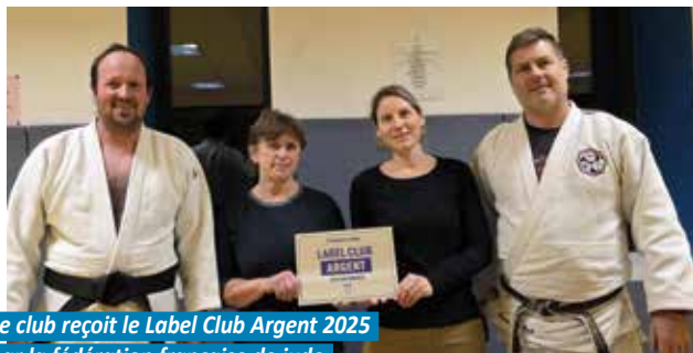
Le club reçoit le Label Club Argent 2025 par la fédération française de judo