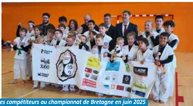
Les compétiteurs au championnat de Bretagne en juin 2025 reviennent avec 64 médailles dont 21 titres.