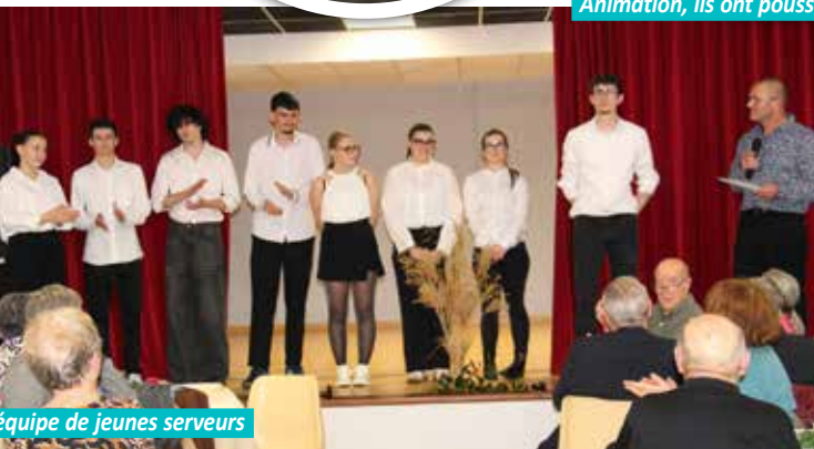
L'équipe de jeunes serveurs