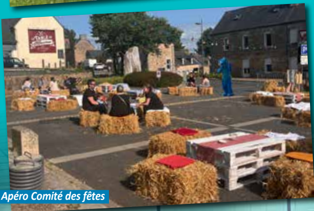
Apéro Comité des fêtes