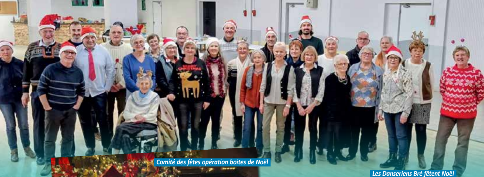
Comité des fêtes opération boîtes de Noël