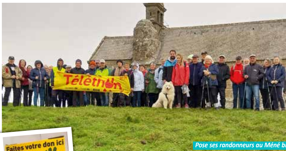
Pose ses randonneurs au Méné bré

Nous notons une moindre mobilisation sur LOUARGAT cette année mais nous avons cependant collecté pas moins de 1 645 €.