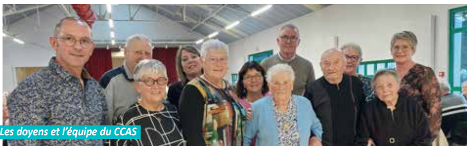
Les doyens et l'équipe du CCAS

A l'issue des cérémonies du souvenir, comme les autres années, le traditionnel repas du 11 novembre était offert par le CCAS aux personnes de 65 ans et plus, nous comptons pas moins de 234 inscrits.